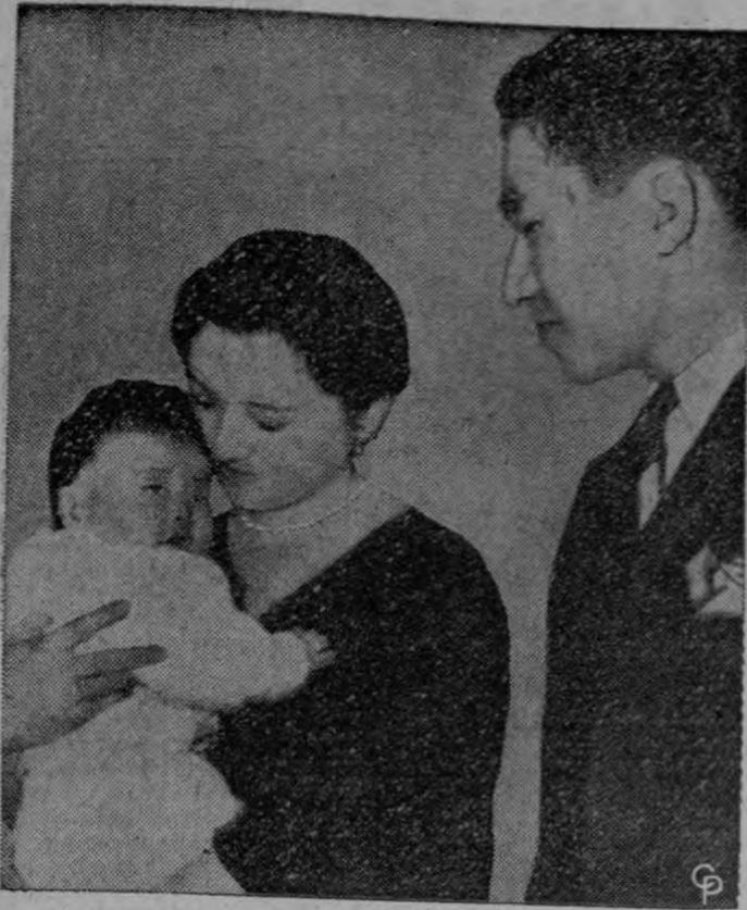
FIESTA ANTES DEL CASAMIENTO: El Príncipe heredero del Japón Akihito, de 25 años, mira a su prometida, la plebeya Michiko Shoda, de 24 años, que sostiene el bebido de un amigo en una fiesta que se dió antes de su boda. La foto, hecha antes del casamiento, los hace como una pareja que ha sido casada por largo tiempo