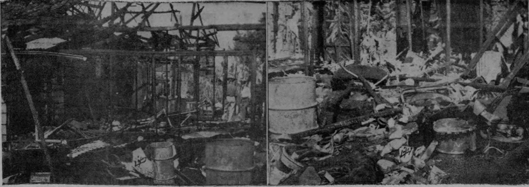
DESPUES DEL INCENDIO. — Así quedaron las casas después del incendio de ayer en Desamparados. La gráfica es elocuente.