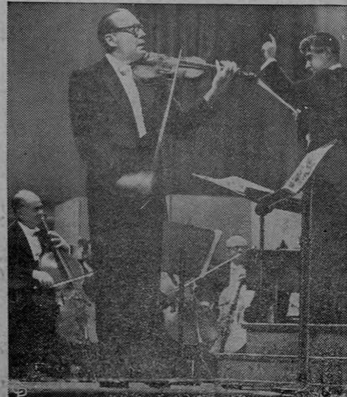
COMICO TOCA EL VIOLIN.—El comediante Jack Benny, que también toca el violín, es acompañado por la orquesta Filarmónica de Nueva York en el Carnegie Hall, durante un reciente concierto a beneficio del fondo de pensiones de la orquesta. A la derecha, el director de orquesta Leonard Bernstein. Benny hizo varias interpretaciones, entre ellas "Amor Naciente"

en las nuevas proposiciones que se hicieron en la primera sesión de la conferencia en octubre, y nuevamente después de Navidad. Se supone que los soviéticos pueden estar preparando alguna nueva acción para mañana, o que meca que los occidentales se propongan presentar nuevo material. (En Washington funcionarios norteamericanos dijeron que los delegados de Estados Unidos presentarán varias sugerencias para superar el impasse).