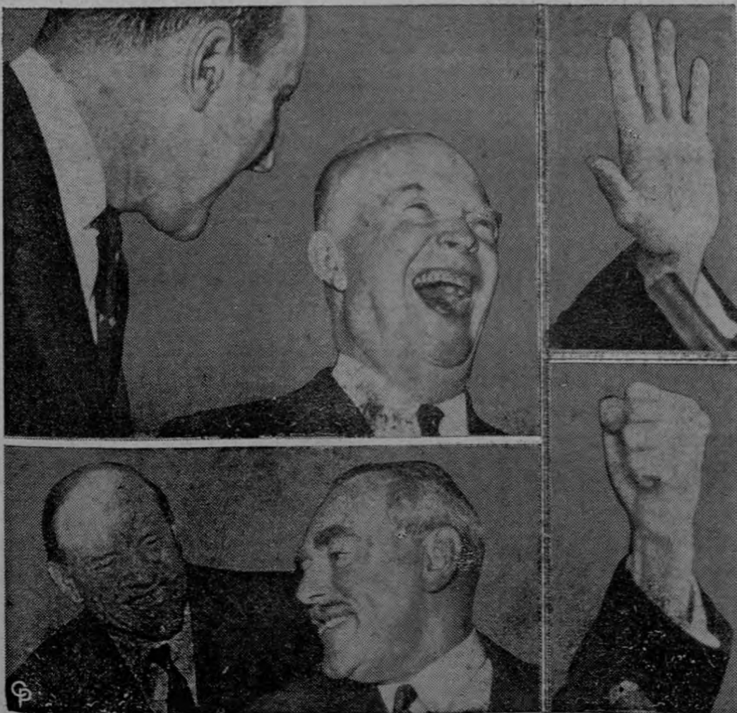
NATO CUMPLE DIEZ AÑOS: El Presidente Eisenhower ríe ante un comentario de J. M. H. Luns (arriba, izquierda), Presidente de la Organización del Tratado del Atlántico del Norte, en el décimo aniversario del pacto celebrado en Washington. El subsecretario de Estado Robert Murphy (abajo, izquierda), charla con el ex-Secretario de Estado Dean Acheson, uno de los que firmaron originalmente cuando se creó el pacto de defensa, compuesto de 15 naciones. El Presidente Eisenhower dijo que los "dedos de la NATO pueden convertirse en un puño, en un arma formidable de defensa"